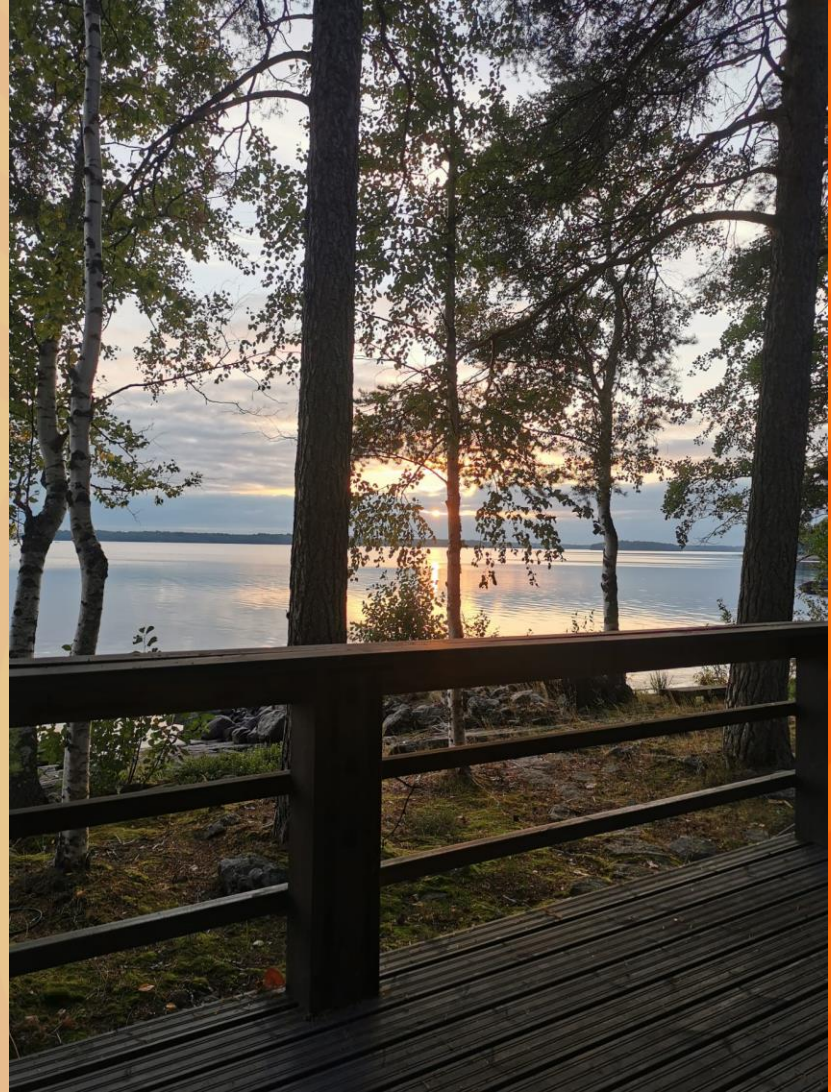
Porosaari, Etelä-Savo. Suomen luonnon päivän illassa 28.8.2021